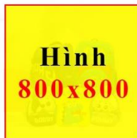
Cặp Ba lô