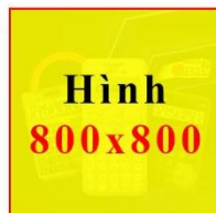
Máy tính Casio