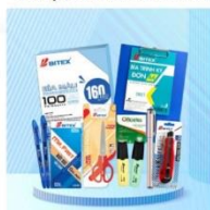
Văn phòng phẩm Bitex