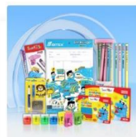
Dụng cụ học tập Smartkids